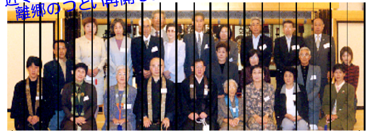
5年前の2001年10月17日、本願寺を会場に開催した離郷門信徒のつどいのスナップです。京都・大阪・滋賀・奈良・愛知より23名の参加がありました。